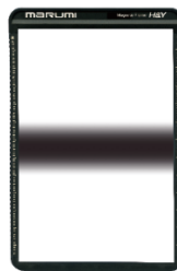
100×150 [ Center GND16 ]